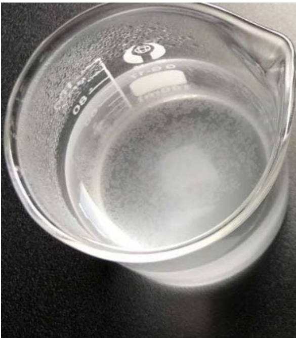
OHNE DEN EVOADSORB